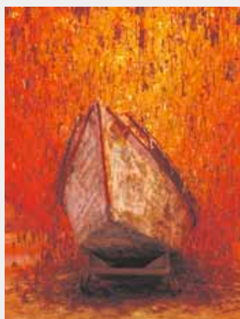
Chiharu Shiota , the Key in the Hand , japanischer Pavillon