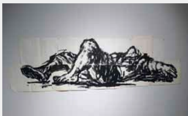
William Kentridge , italienischer Pavillon