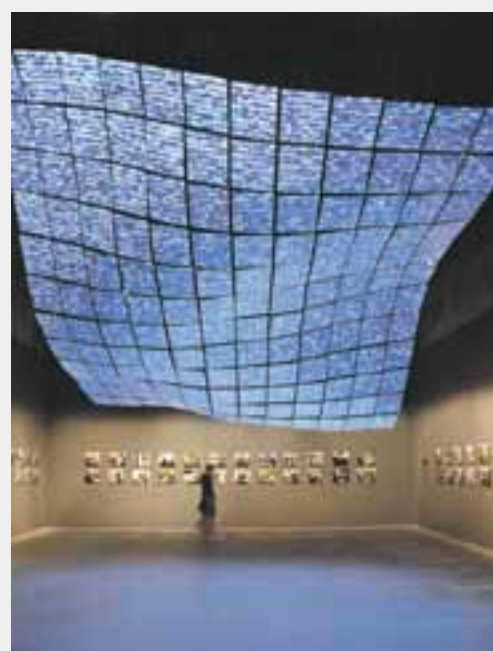
Kutlug Ataman , the Portrait of Sakip Sabanci , 2014, Arsenal