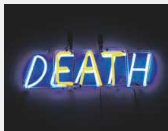
Bruce Nauman , American Violence