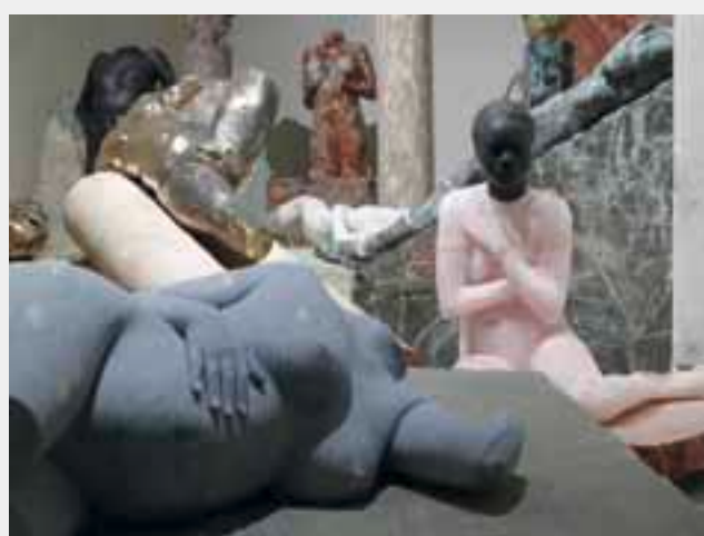
Vanessa Beecroft , le membre fantome , italienischer Pavillon