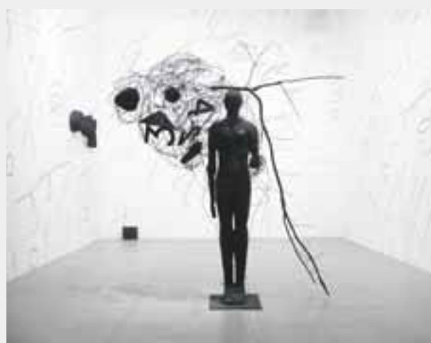
Mimmo Paladino , italienischer Pavillon - „Codice Italia“