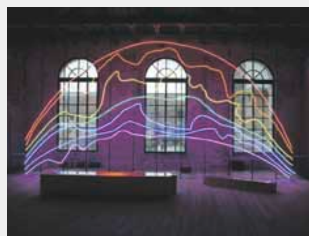
Sarkis , Respiro , türkischer Pavillon